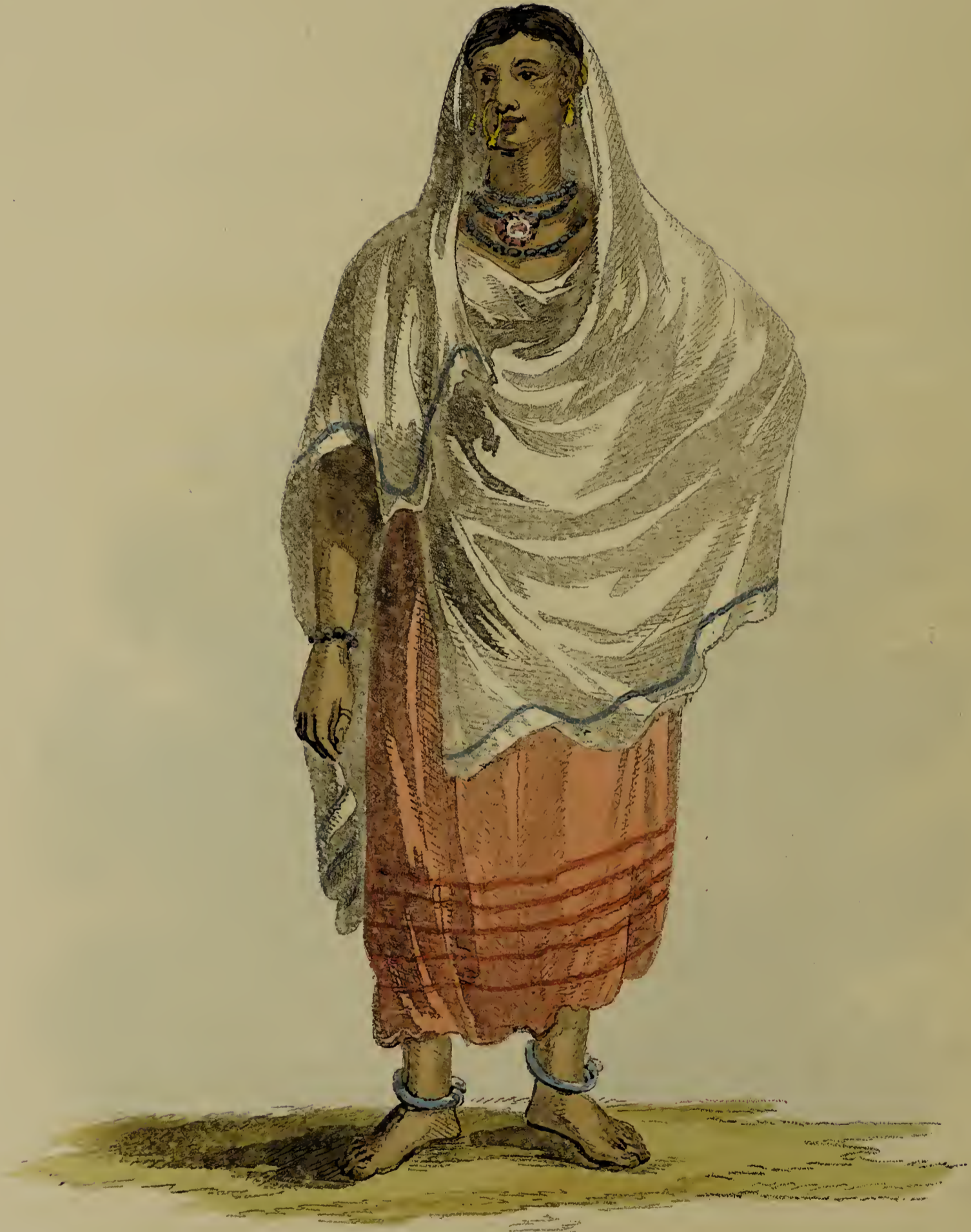
Bal l Sobhyns pint e Calcutta.